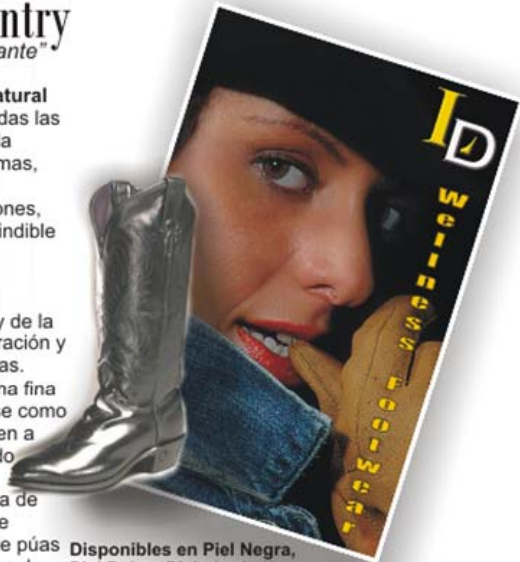
Disponibles en Piel Negra, Piel Beig y Piel girada Negra

El sistema WNS (Wellness Natural Sole) con el que están fabricadas las botas LD, no sólo garantizan la comodidad y durabilidad máximas, sino que proveen a tus pies, y especialmente a tus articulaciones, de una amortiguación imprescindible ante los impactos constantes producidos por el baile en sí. El uso de materiales naturales permite la circulación del aire y de la humedad facilitando la transpiración y el secado rápido de las plantillas. Las botas LD fabricadas en una fina y elegante piel, deben ajustarse como un guante, de modo que ayuden a mantener el equilibrio adecuado sobre la pista de baile. La suela especial de piel girada de alta resistencia, debe cepillarse habitualmente con un cepillo de púas metálicas, para retirar los restos de cera de las pistas de pàrquet, u otro tipo de suciedad que perjudican un correcto deslizamiento de las botas.