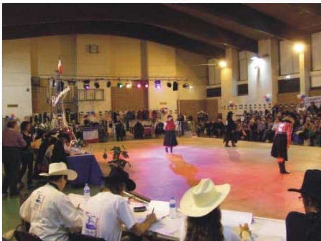
Vista general de la pista de competición

El subtítulo de este artículo sólo pretende indicar que hay varias vías abiertas en el mundo del country, y que no siempre todos vemos las cosas igual cuando pretendemos potenciar nuestra querida especialidad de baile.