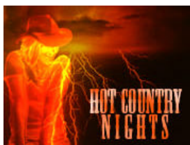
Nuevo logo de las noches country de Cities in Line

Domingo 2 Septiembre Tarde "Recarga de Pilas" bailes Partner con técnica Smooth